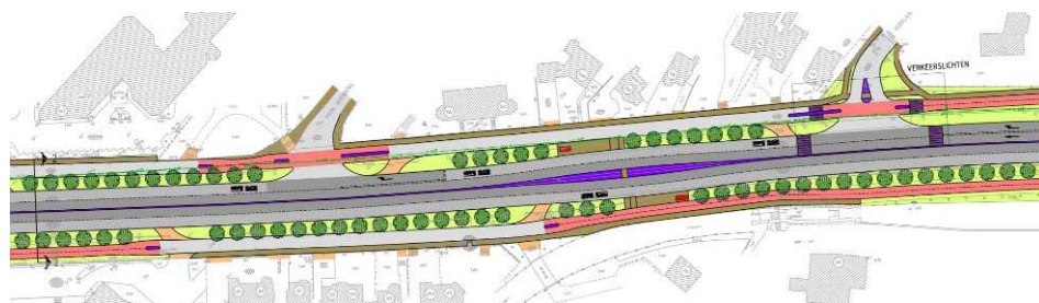
fragment plankaart zoals deze in oktober 2009 door de provincie Utrecht is gepresenteerd